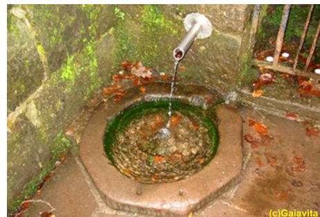
Quelle am Odilienberg im Elsaß

Ohne diesen wichtigen und lebensspendenden Impuls ist auf die Erde kein Leben möglich, egal in welcher Form. Wasser erzeugt Wachstum und Leben.“